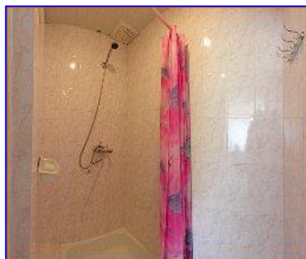
Санузел в номере Комфорт