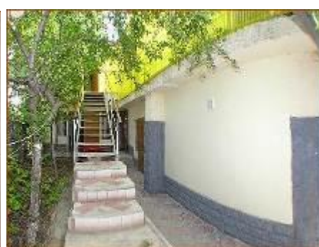
Лестница на 2-й этаж

Стоимость путевки на 1 человека :( проживание 10дн./9н., проезд)