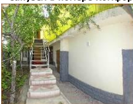
Лестница на 2-й этаж